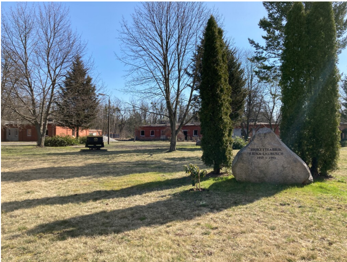
Gedenkstätte für die ehemalige Brikettfabrik Erika-Laubusch, Ansicht Gedenkstein