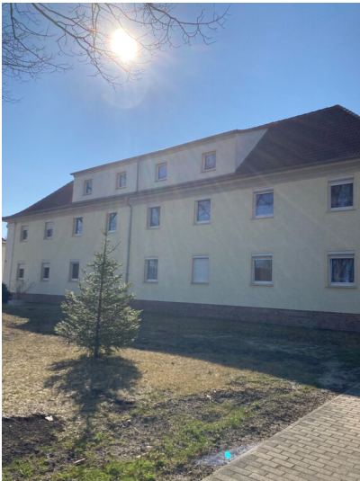
Arbeiterwohnhaus der Bergmannsheimstätten Laubusch, Ansicht von Osten