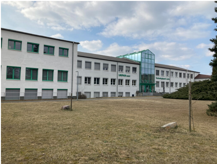
Ehemalige Lehrwerkstatt des Aluminiumwerkes Lauta, Ansicht von Osten