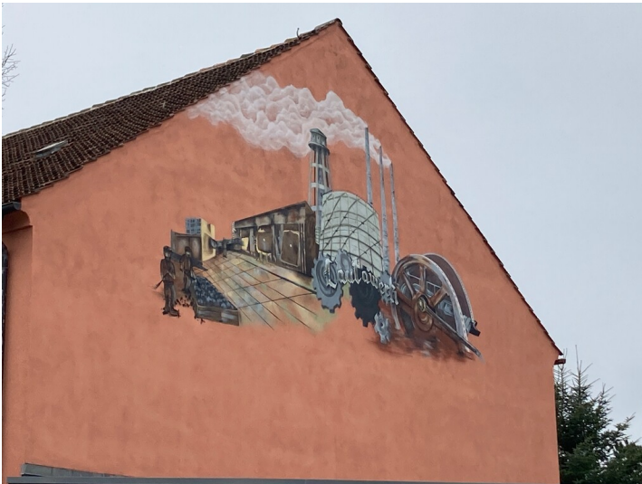
Wandbild Lautawerk, Ansicht von Westen