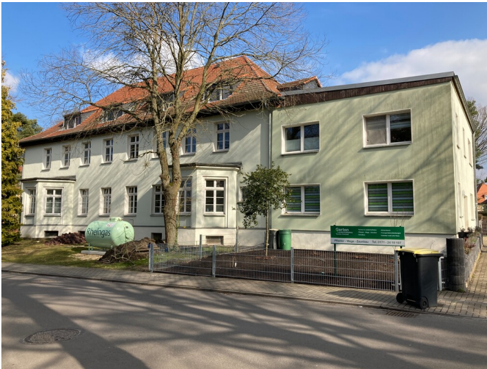
Beamtenwohnhaus der Gartenstadt Lauta-Nord, Ansicht von Westen