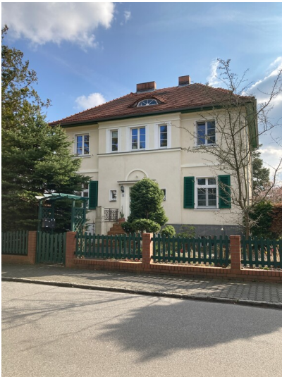
Beamtenwohnhaus Gartenstadt Lauta-Nord, Straßenansicht von Osten