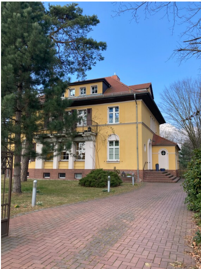
Villa Gartenstadt Lauta-Nord, Straßenansicht von Süden