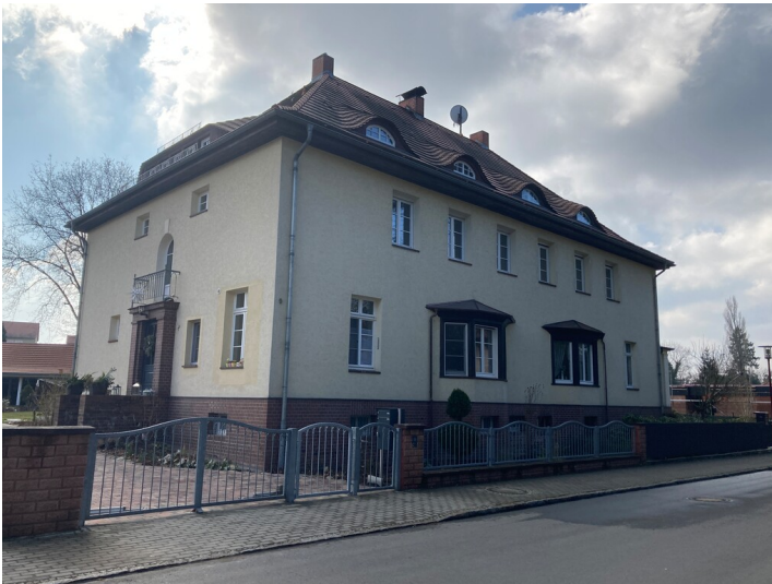
Beamtenwohnhaus Gartenstadt Lauta-Nord, Straßenansicht von Nordosten