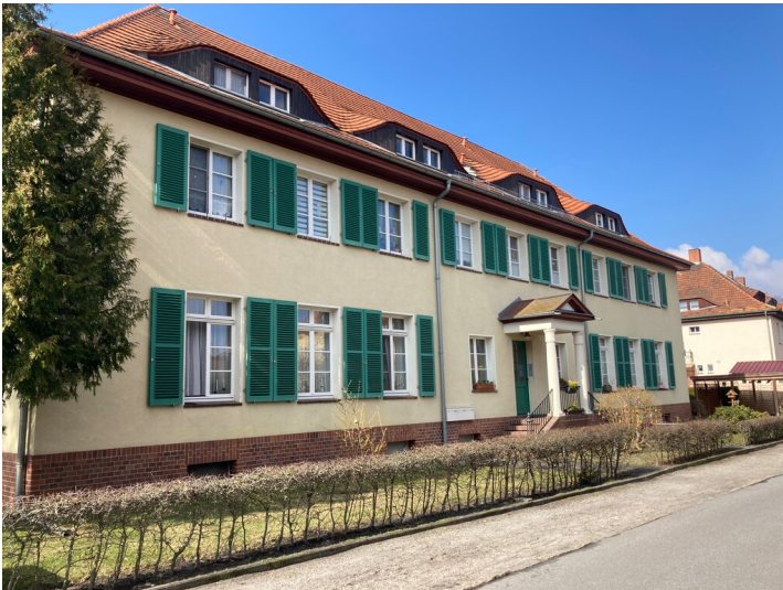
Beamtenwohnhaus der Gartenstadt Lauta-Nord, Straßenansicht von Süden