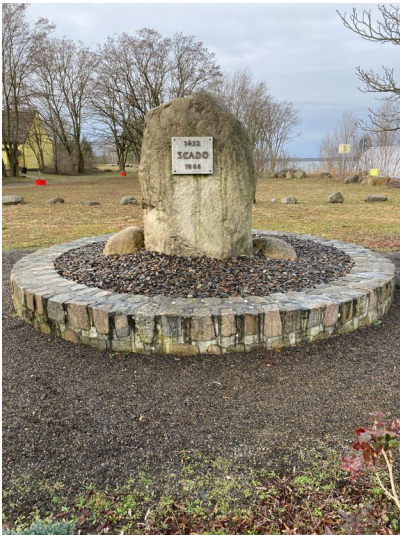
Gedenkstein für den devastierten Ort Scado