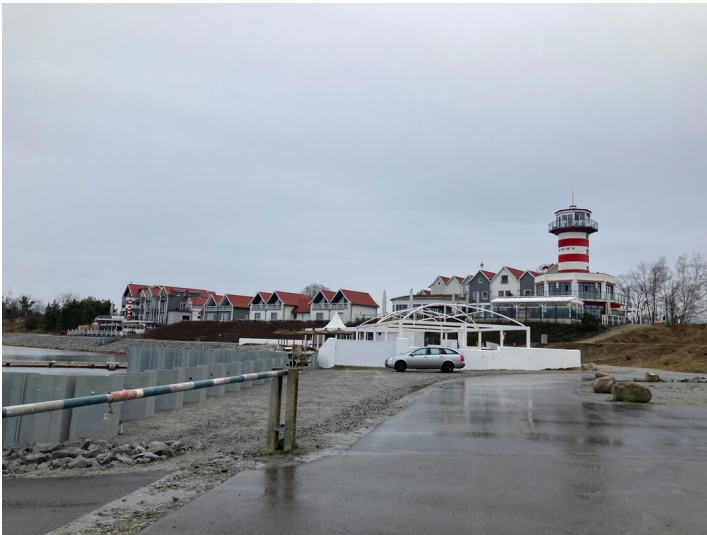
Geierswalder Wasserwelt, Ansicht Promenade mit Leuchtturm