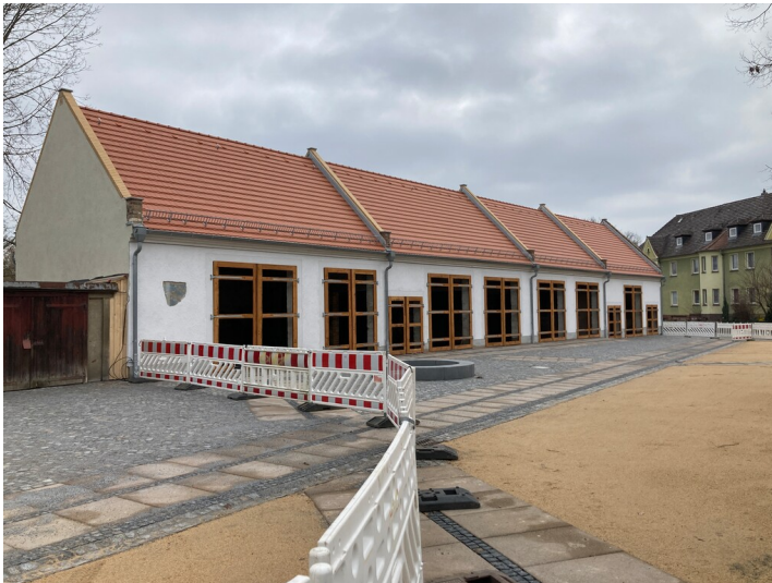
Stadtscheunen des Alunwerkes Bad Muskau, Ansicht von Westen