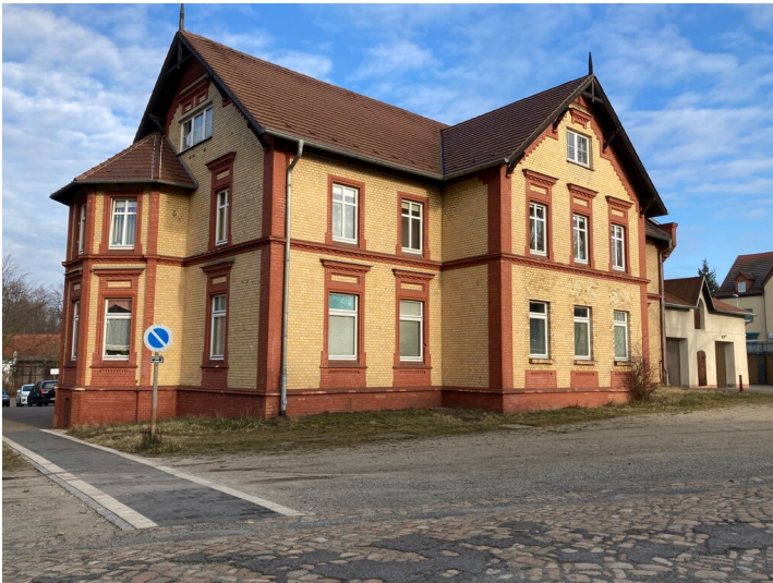
ehemaliges Verwaltungsgebäude der Keulahütte, Ansicht von Südwesten