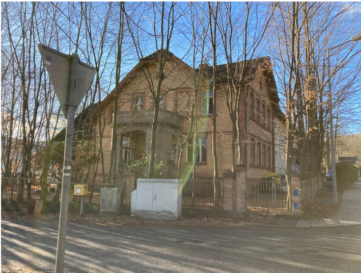
Fabrikantenvilla "Hohlglaswerke Sallmann", Ansicht von Nordosten