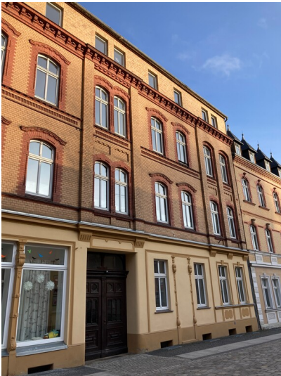
Wohnhaus der Töpferei Lehmann, Ansicht von Südwesten