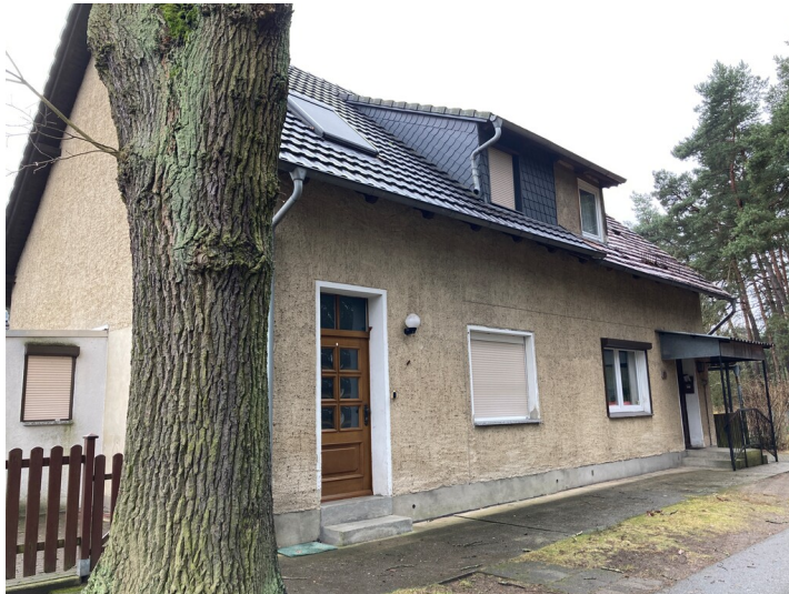
Einfamilienwohnhaus der Bergarbeitersiedlung "Kolonie Pechern", Ansicht von Nordosten