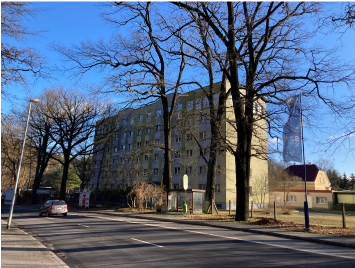
Verwaltungsgebäude "Wissenschaftlich-Technisches Werk Bad Muskau", Ansicht von Nordwesten