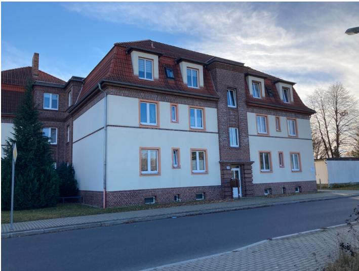
Mehrfamilienhäuser der "Glashüttenwerke Hirsch, Janke & Co, Abteilung Malkey, Müller & Co", Ansicht Norden