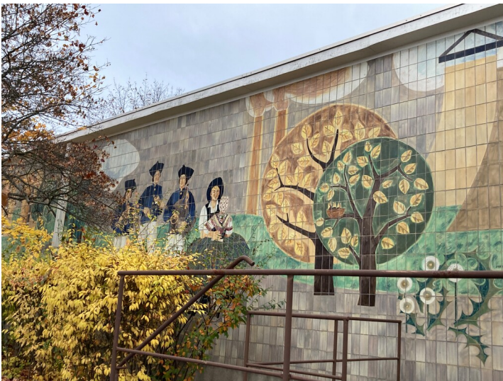
Wandbild "Sorben", Ansicht von Norden