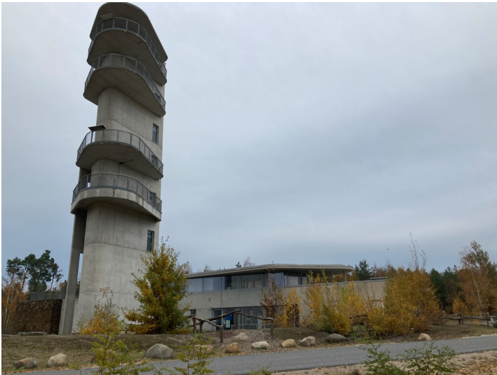
Aussichtsturm des Kommunikations- und Naturschutzzentrums Weißwasser, Ansicht von Nordwesten