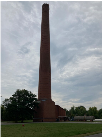
Nordschornstein mit Fuchs und Resten des ehemaligen Kesselhauses der Brikettfabrik Knappenrode, Ansicht von Norden