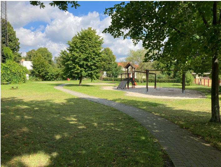
Grünanlage mit Spielplatz Friedrich-Ebert-Straße, Ansicht von Süden