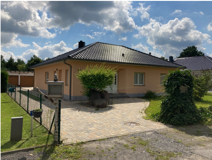
Einfamilienhaus, Am Bergbaumuseum 3, Ansicht von Norden