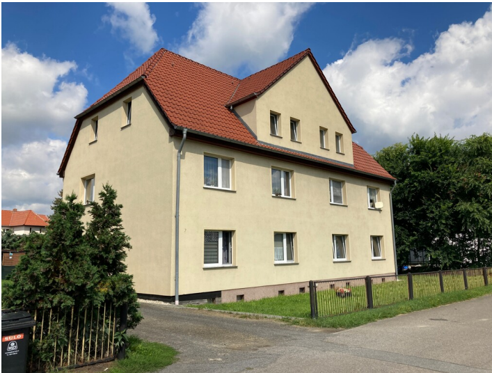
Mehrfamilienwohnhaus Friedrich-Ebert-Str. 15, Straßenansicht von Südosten