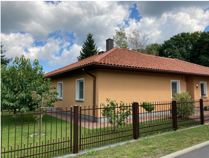
Einfamilienwohnhaus Friedrich-Ebert-Str. 12, Ansicht von Süden