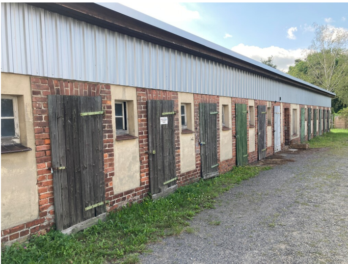
Mehrfamilienwohnhaus Friedrich-Ebert-Straße 11, Ansicht Schuppen