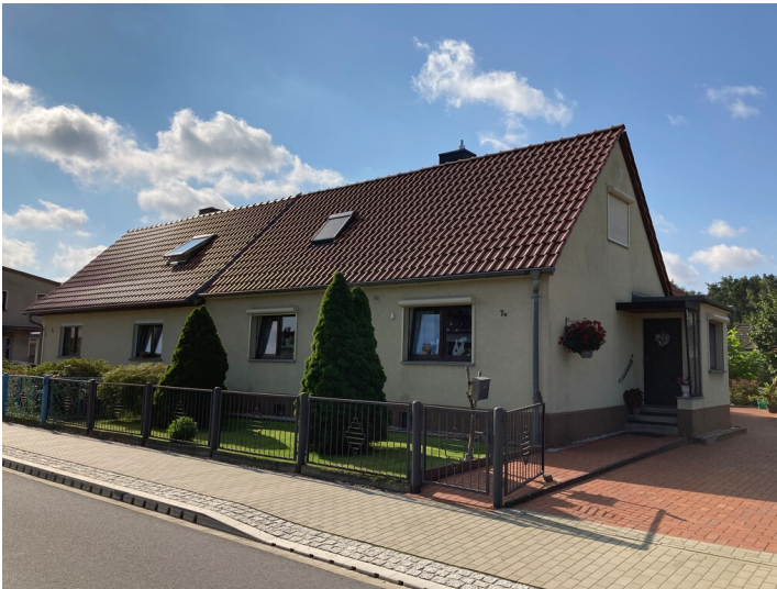
Doppelwohnhaus Friedrich-Ebert-Str. 7, Straßenansicht