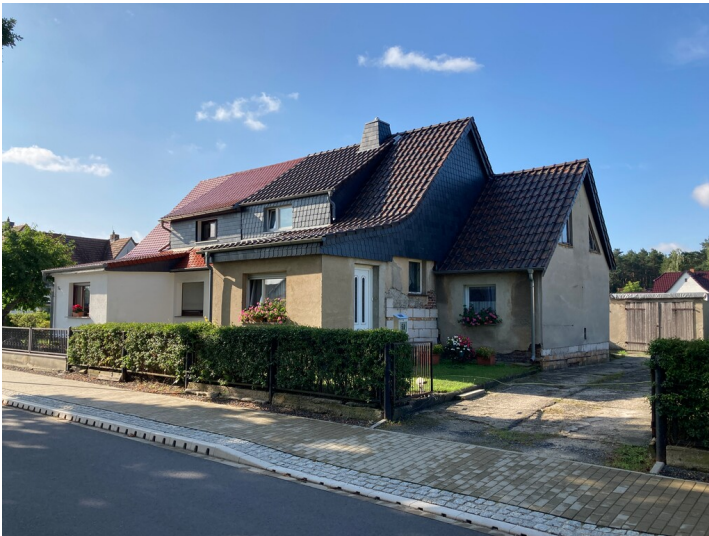
Doppelwohnhaus Friedrich-Ebert-Str. 5, Ansicht von Nordwesten