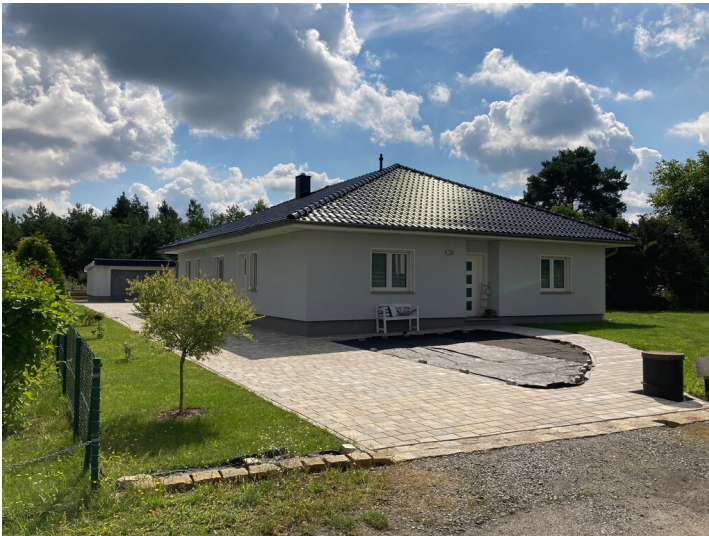
Einfamilienwohnhaus Am Hochwald 10, Ansicht von Norden