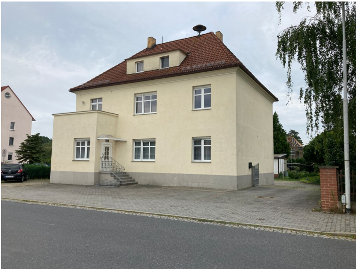
Wohnhaus, ehem. Post und Landjägerei Knappenrode, Ansicht von Osten