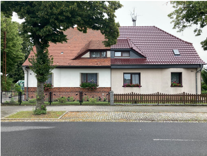
Doppelwohnhaus Karl-Marx-Str. 3a; 3b, Ansicht von Westen