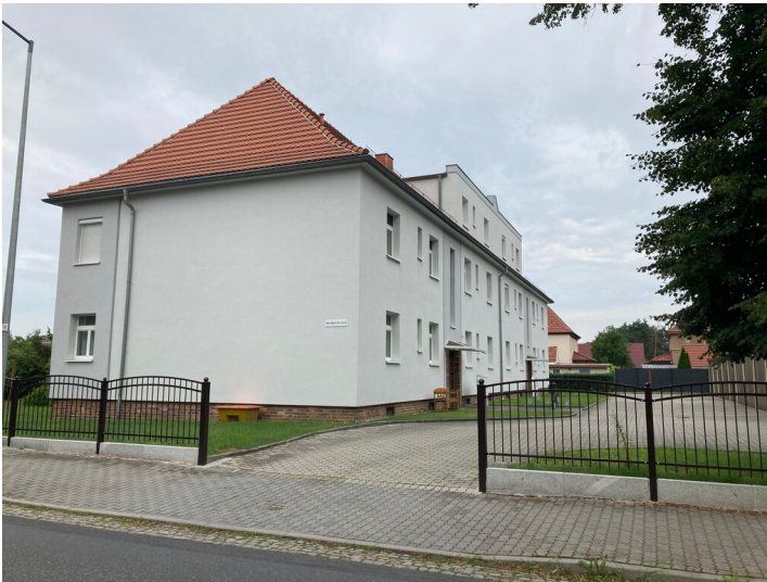
Wohngebäude Karl-Marx-Str. 2a; 2b, Ansicht Osten