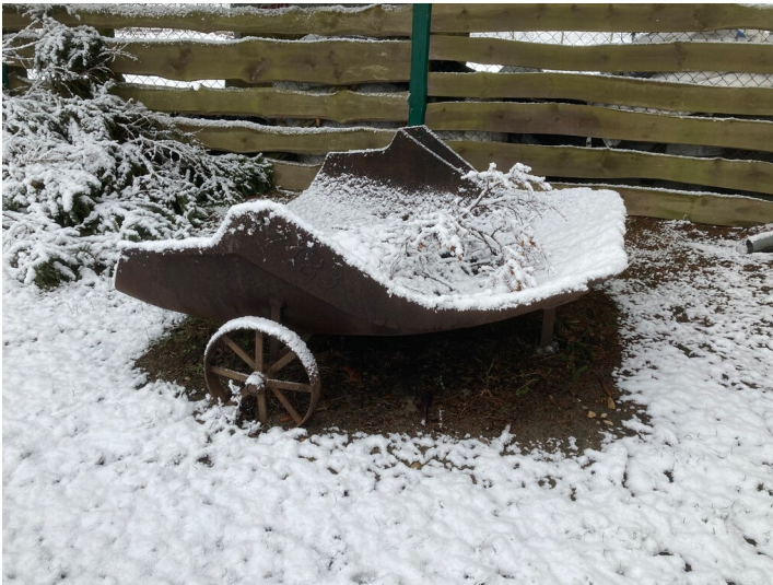
Umgebaute Schaufel eines Schaufelradbaggers