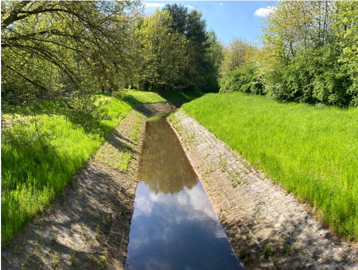
Mortkaer Graben