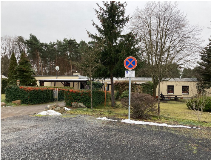
Klubgaststätte Boxberg