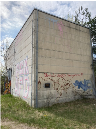
Wasserwerk Tagebau Scheibe