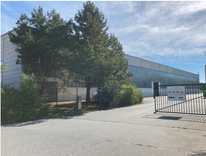
Glaswerk Schwepnitz Industriestraße