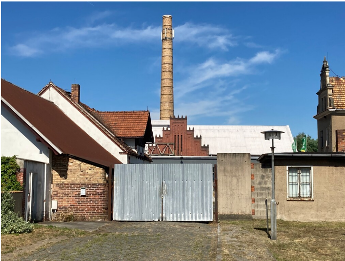
Lochmannhütte Schwepnitz