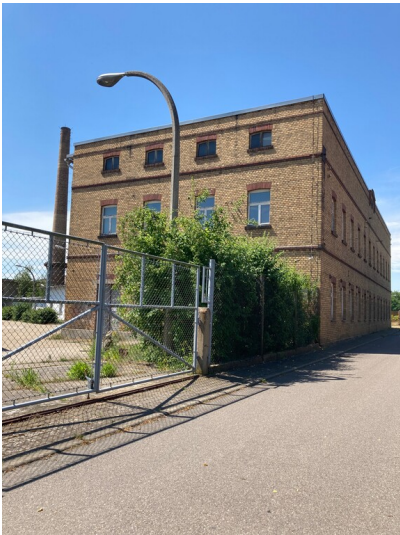
Betriebsteil des Synthesewerkes Schwarzheide