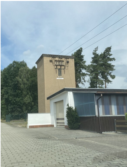
Transformatorenstation Torno