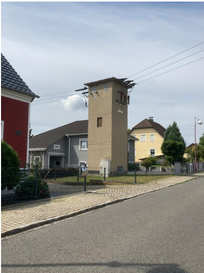
Transformatorenstation Leippe