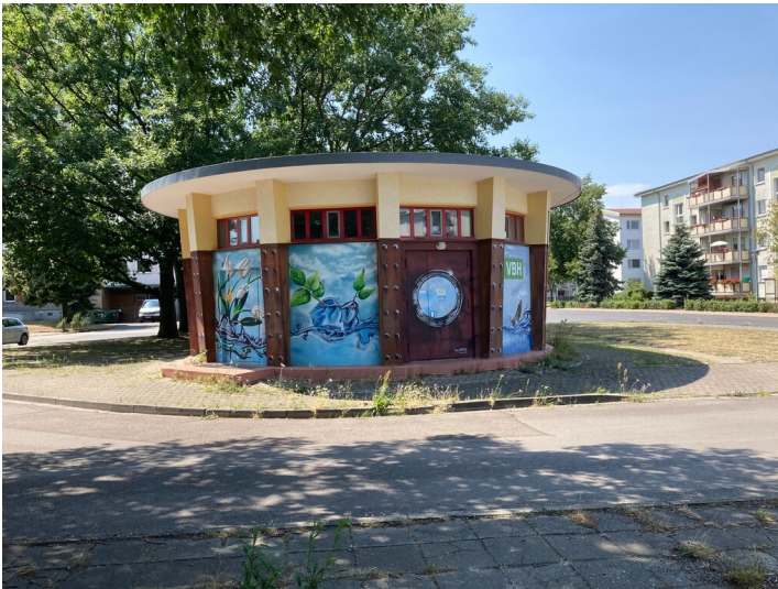
Wohnkomplex VII

Schlagwörter: Siedlungsteil Fachsicht(en): Denkmalpflege Gemeinde(n): Hoyerswerda Kreis(e): Bautzen Bundesland: Sachsen