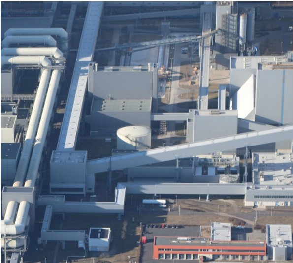
Eckturm Bekohlung