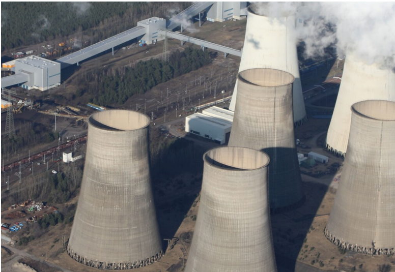
Schweißfachbetrieb und Servicespezialist für Braunkohlemahlanlagen und Wälzlager