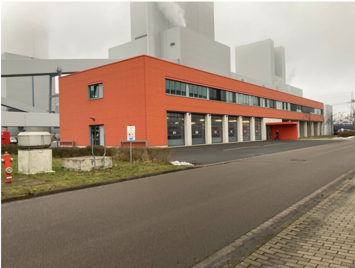
Feuerwache auf dem Kraftwerksgelände Boxberg