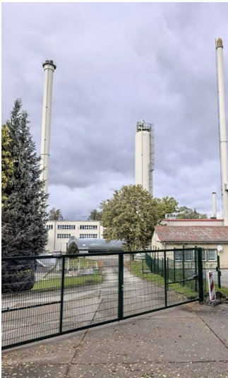
Braunkohlenstaubkraftwerk zur Nahwärmeerzeugung