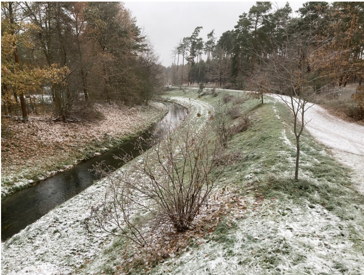
Verlegung des Schwarzwassers um den Tagebau Werminghoff I