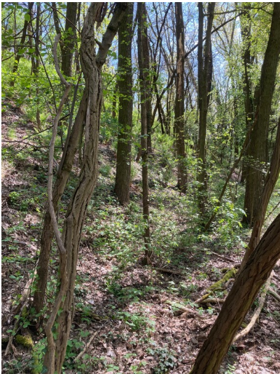
Kippe der Braunkohlengrube Guhra