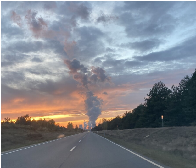
Umverlegung der Bundesstraße 156 aufgrund der Flächeninanspruchnahme durch den Tagebau Nochten