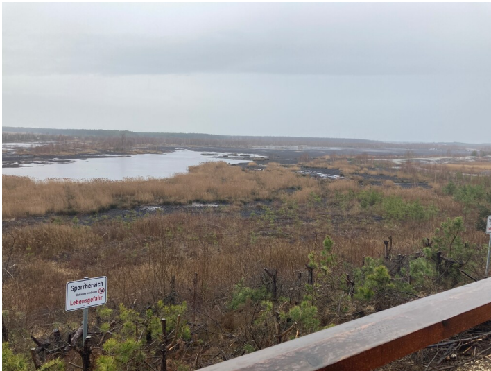
Bergener See